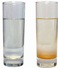
汲みたての湧き水 数時間後 リモナイトと水 に分かれる