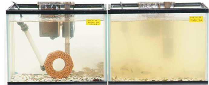
《エコバイオリング投入1ヵ月後の比較》